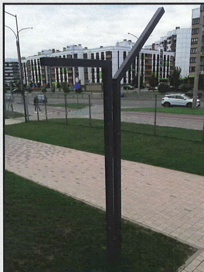
Опора «Хайтек», д.Копище, Боровлянский с/с, Средняя школа № 1 (Школа будущего)