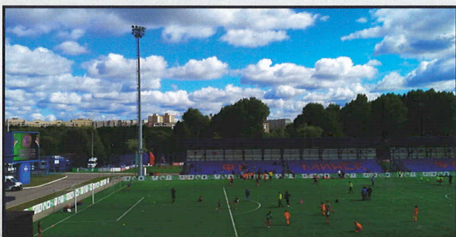
Мачта с наклонной площадкой и лестницами, 30 м, ФК «Минск», г. Минск