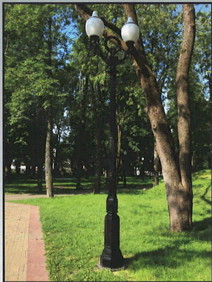
Опора освещения, высокохудожественное литье (чугун), г. Минск, парк им. Я.Купалы