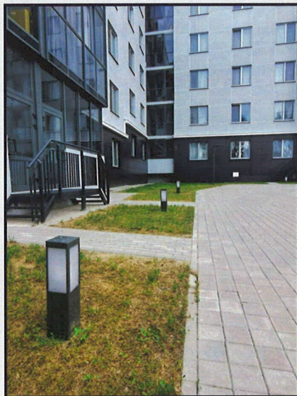
Опора «Тауэр», высота 0,5м, Индустриальный парк «Великий камень», жилой квартал