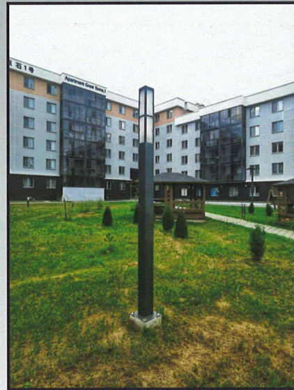
Опора «Тауэр», высота 1,5м, Индустриальный парк «Великий камень», жилой квартал