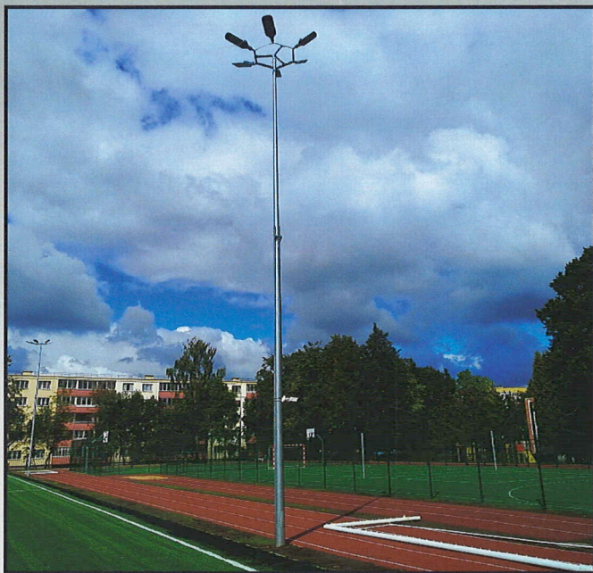
Складывающаяся опора, 16 м, средняя школа № 71, г. Минск