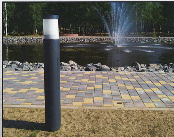
Опора «Стелла», высота 1м, Центральный парк в г. Осиповичи