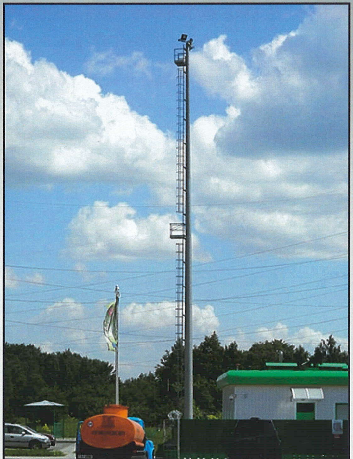
Мачта 25 м, База нефтепродуктов, г. Жлобин