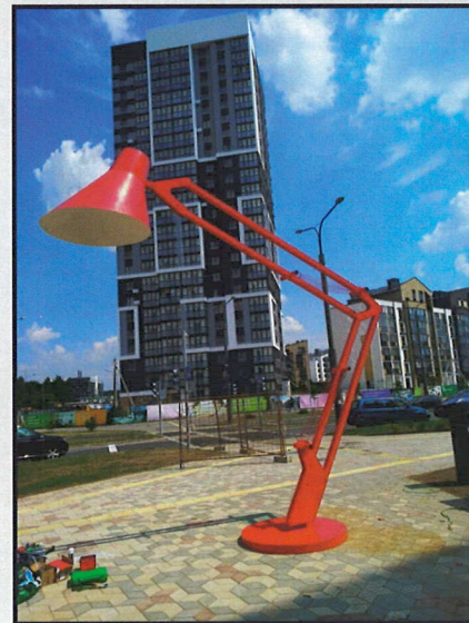
Опора «Лампа», высота 5м, Новая Боровая