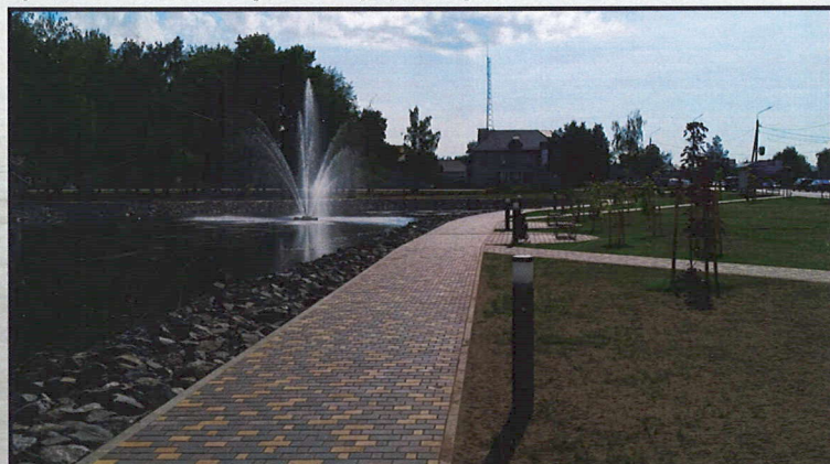
Опора «Стелла», высота 1м, Центральный парк в г. Осиповичи