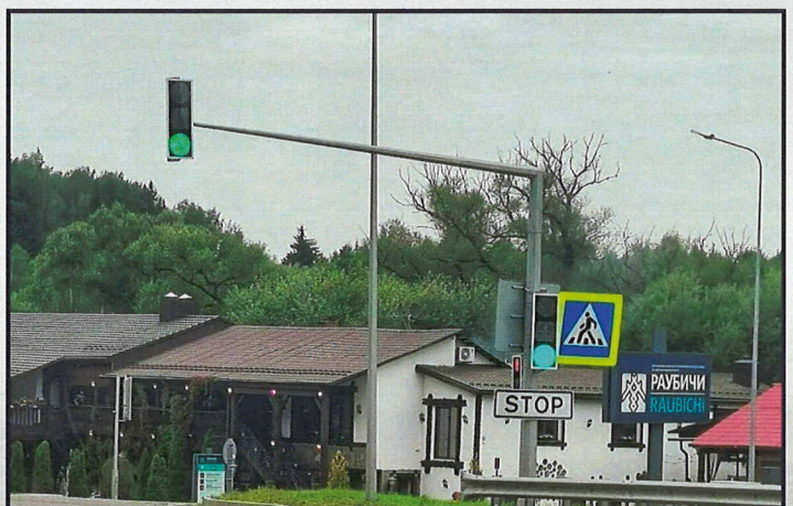
Светофорная стойка для автодорог, трасса Р80, д. Раубичи